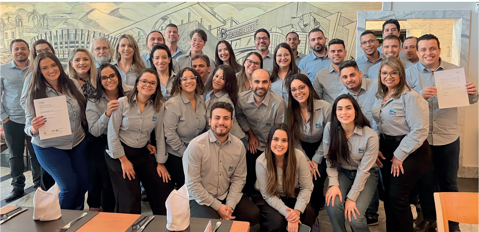
Equipo de la sede de Minas Mineração con certificado ISO 9001 y certificado de adhesión a ISO 31000.

Siempre enfocados en el desarrollo sostenible y buscando la diversificación de su oferta de servicios, Minas Mineração también desarrolla investigaciones minerales para diversos sectores.